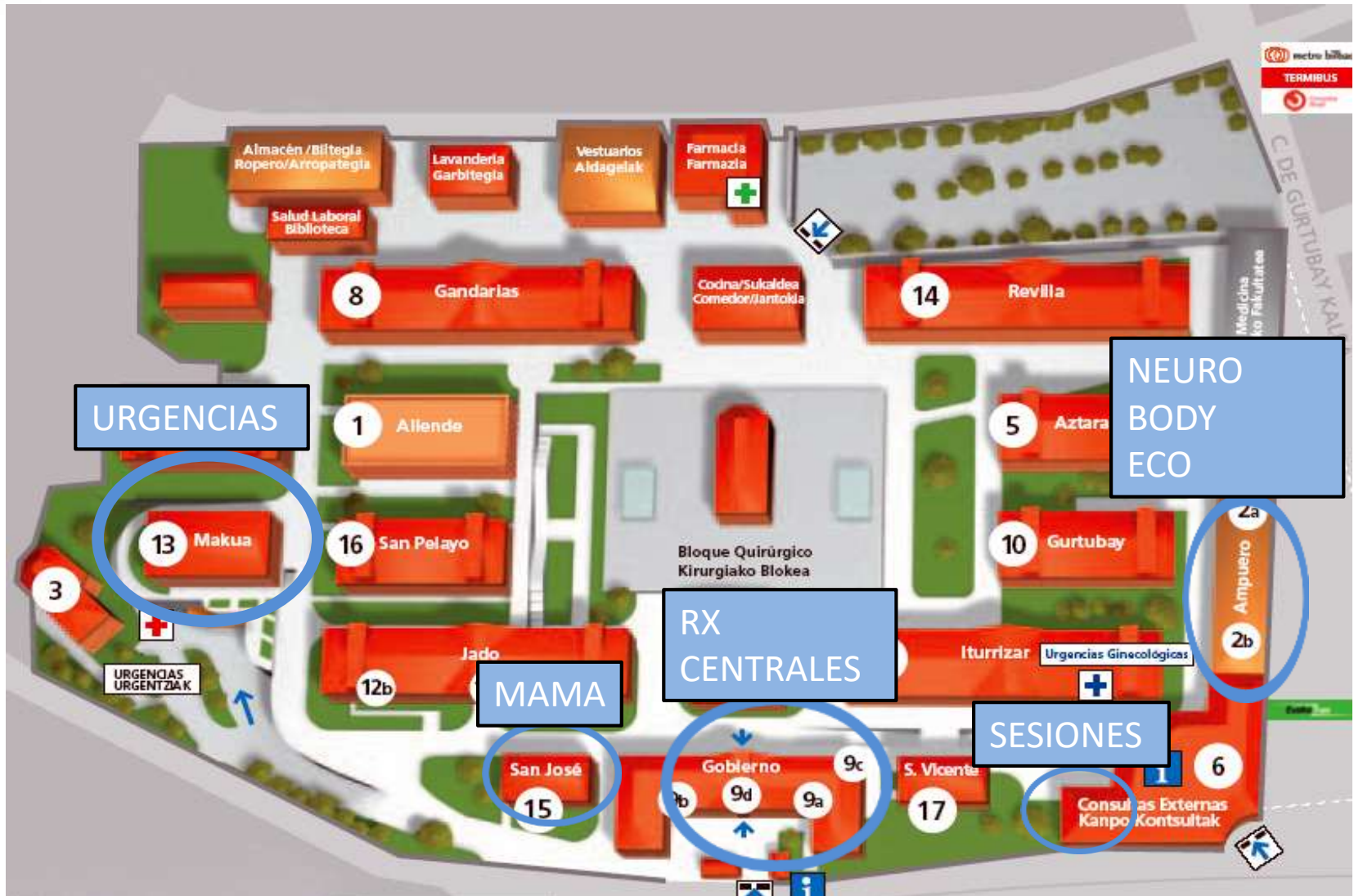
Semana de Puertas Abiertas 2023. Hospital Universitario Basurto, Servicio de Radiodiagnóstico