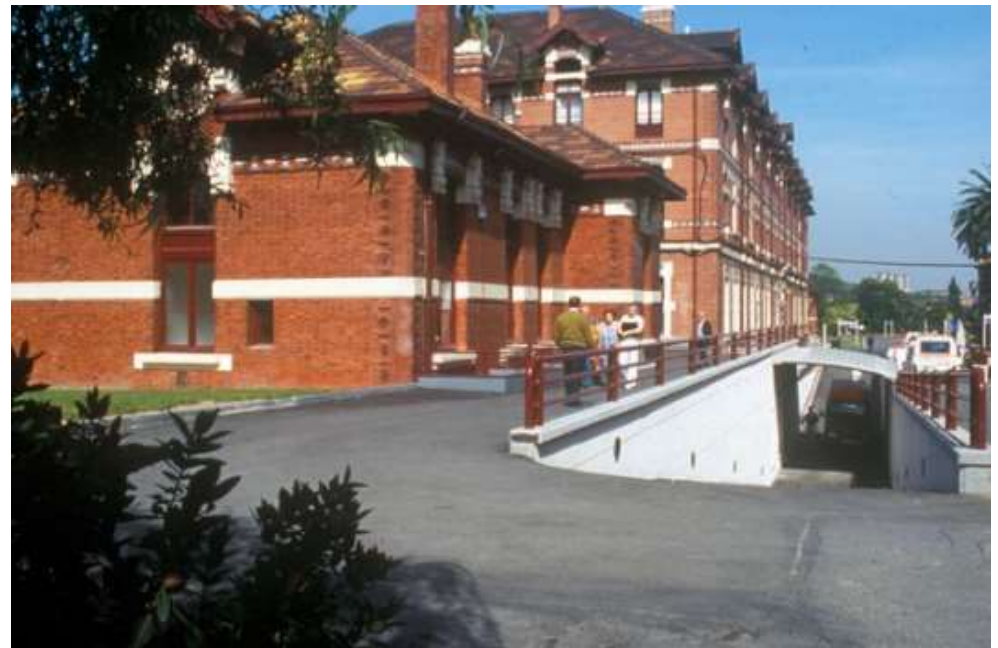
Pabellón San Vicente