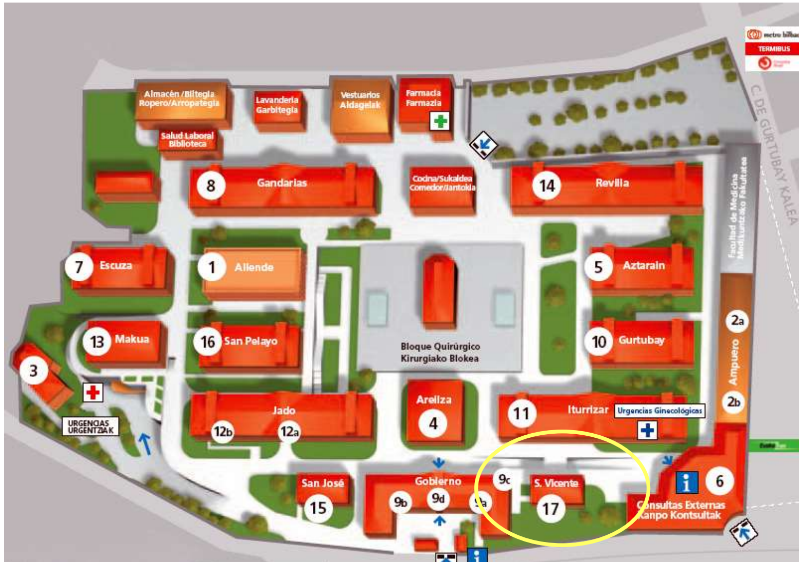
Semana de Puertas Abiertas 2023. Hospital Universitario Basurto, Servicio de Oncología Radioterápica