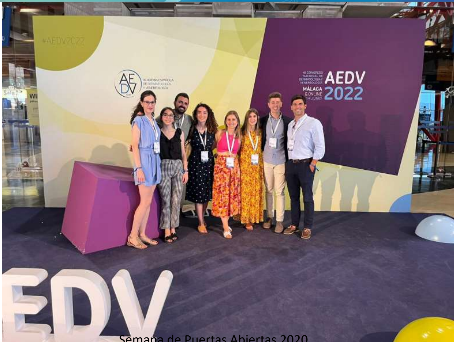
Semana de Puertas Abiertas 2020. Hospital Universitario Basurto Servicio