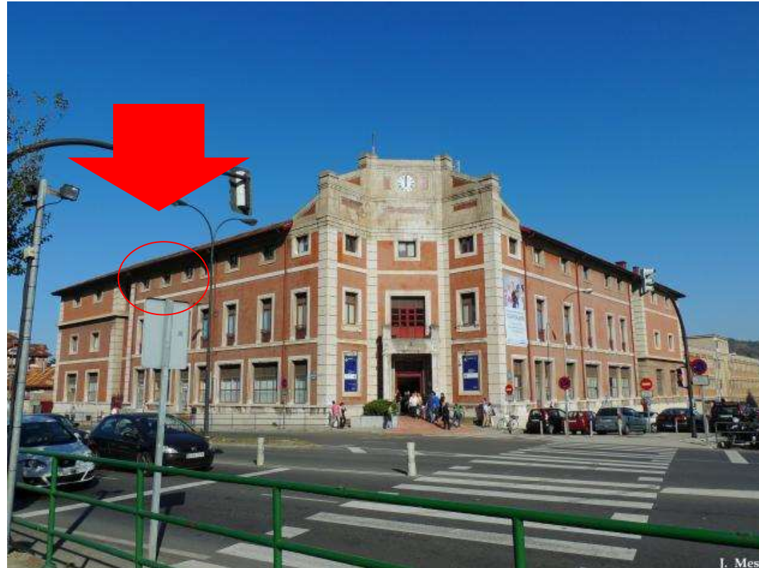
FOTO DEL PABELLON

Donde convivimos y Trabajamos estrechamente