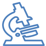
Semana de Puertas Abiertas. Hospital Universitario Basurto, Servicio de Anatomía Patológica